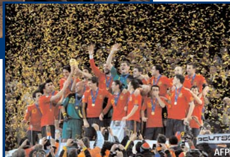
La Spagna campione del mondo

liano, francese, russo e un segnale TV gestito dal canale francese TF1, disponibile in Francia sulla piattaforma digitale FRANSAT.