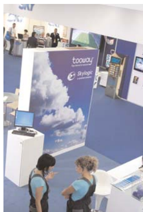
Lo stand Eutelsat

Digitale terrestre, 3D TV, televisione e banda larga via satellite, cinema digitale e in 3D. Questi i temi che hanno tenuto banco nel corso di All Digital, la grande manifestazione dedicata alle nuove tecnologie che si è tenuta presso la Fiera di Vicenza dal 17 al 19 giugno. Sono stati oltre 700 i professionisti che hanno partecipato ai convegni e ai seminari di formazione. Tra le tematiche che sono state approfondite, l'accesso universale alla banda larga e l'importanza delle connessioni ad alta velocità per lo sviluppo delle aree rurali. Se ne è parlato nel convegno di apertura, partendo da un dato significativo: secondo l'Osservatorio Banda Larga soltanto il 44% degli italiani ha accesso a internet a 7 Megabit.