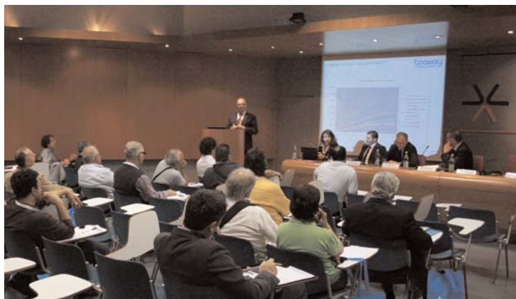
Meeting Nazionale Tooway™

na senza cavi in uscita. Una soluzione disponibile per tutti, ottimale per le zone scoperte dell'ADSL, che in Italia conta circa 3mila utenze. «L'Italia è il paese meglio organizzato per quanto riguarda il settore dell'installazione», ha affermato Thomas Lohrey di Eutelsat. Lohrey ha introdotto, nel dettaglio, il satellite Ka-sat, che sarà in orbita entro fine 2010: «Con i suoi 70 Gbps di potenza, il più grande del mondo, Ka-sat avrà una capacità pari a 35 satelliti HOT BIRD™. Riguardo all'Italia, essendo estesa in lunghezza, ha un'eccellente copertura con 8/9 spot». Oltre ad approfondire le que-