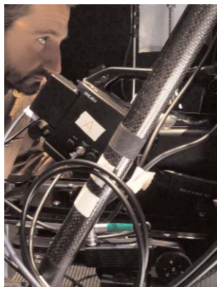
Riprese in 3D

lo sviluppo del 3D – tra cui Sony – ha ottimizzato una piattaforma commerciale di proiezione in 3D nei cinema. Oltre 250 ore di calcio giocato sono state quindi trasmesse negli schermi cinematografici di 19 Paesi, soprattutto in Germania, Italia, Spagna, Francia, Russia, Polonia, nei Paesi scandinavi e baltici.